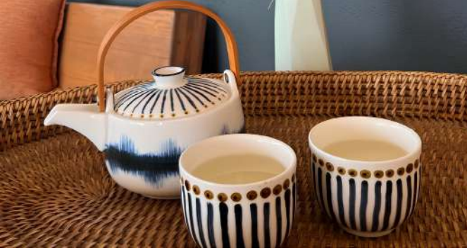
Sınırsız detoks orba, bitki ayı, ph10 su